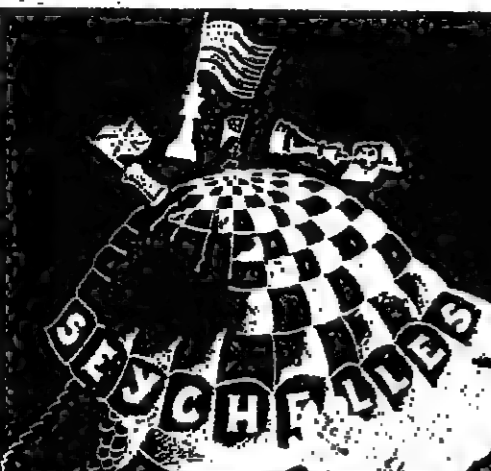
خريطة تظهر جزر سيشل في المحيط الهندي